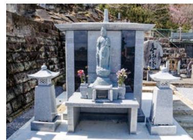
施工した永代供養塔。右端の参道は元々お寺にあったものを再利用するなど、随所に細かな工夫がされている

お客様の故人への想いを少しでも汲み取ろうと、打ち合わせでは、墓石の形状（洋型・和型）、厚みやデザインはどうするかなど、時間をかけてご要望を伺う。このような傾聴力と豊富な知識により、何百種類に及ぶ石材の中から、最適なデザイン、色、石質を提案し、細やかなところまで気配りを欠かさない。施工時には「ご先祖様や故人の第二の家を支えるサポート役」として、完成後も必要に応じてメンテナンスを施す。こうした丁寧な仕事ぶりに加え、コミュニケーションを大切にしている社長の人柄も相まって、先代から続くお客様や紹介により来店される方が多く、地域になくはない石材店として信頼を得ている。