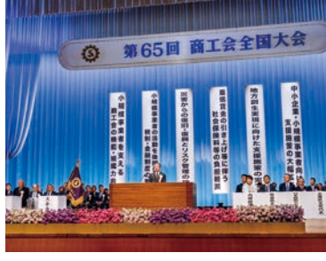
全国大会では、6項目の大会決議が決定した