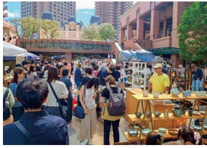
当日は首都圏を中心に、大勢のお客様が来場した

9月20日、21日の2日間、「益子陶器市at恵比寿ガーデンプレイス」に商工会ブースを出展した。益子焼の魅力を広く発信することで、来町者の増加につなげることや窯業部会員の販路開拓が目的だ。