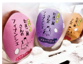
【審査員特別賞】 合同会社薄羽養鶏場 「たまご屋さんのフィナンシェ」

しバイヤートともに商品改良に取り組んだ。「バイヤーズワン」では「合同会社薄羽養鶏場」が審査員特別賞を、「益子のスープ屋Trois」が全国商工会連合会賞を受賞した。受賞後、商品に興味を持った複数のバイヤートとの商談が行われている。