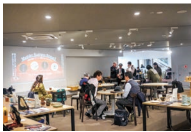
プレゼンテーション後は、自由に話せる雰囲気の中で商談が進められた

会場では益子焼の作品を展示し、4事業者による公開プレゼンテーション等も行われ、自社の魅力を余すところなくアピール。参加した企業の担当者と商談が成立するなどの販路開拓につながった。