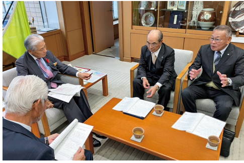
要望書の内容を基に、意見交換等を行った