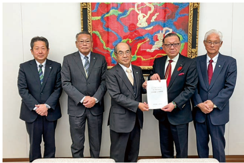
池田県議会議長(左から4番目)に要望書を提出した

企業が抱える課題の解決と稼ぐ力の強化に向けての支援の拡充や、小規模補助金の確保、並びに広域支援体制の整備、さらに、老朽化が激しい商工会館の安全対策等が必要不可欠として、県の支援を求めた。