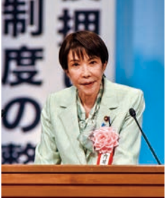
来賓挨拶をする高市早苗 内閣総理大臣

第65回商工会全国大会が11月20日、渋谷のNHKホールにて開催された。全国各地の商工会長や役員等が出席し、本県からは薄井正明商工連会長をはじめ、91名が参加した。