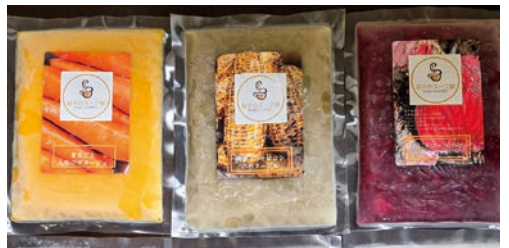
【全国商工会連合会賞】 益子のスープ屋Trois（トロワ） 「季節のスープ3種」

益子町商工会から「バイヤーズワン」では「益子のスープ屋Trois（トロワ）」が審査を通過