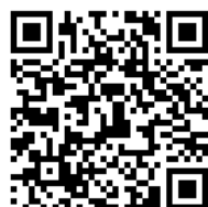
県HP「栃木県消防団応援の店」

登録後に配布される表示シールをレジ前等の目立つ場所に掲示してください。 消防団員やその家族等から「消防団応援の店利用証」の提示がありましたら、 サービスの提供をお願いします。 ※サービス内容は、店舗が自由に決めることができます。サービス提供に係 る費用は店舗の負担でお願いします。